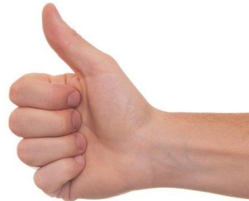
Ok, tout va bien