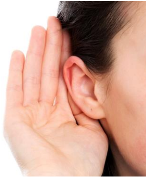
Je n'entends pas