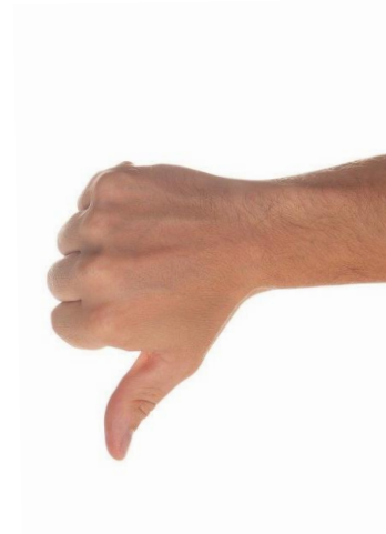
Ça ne va pas, je ne comprends pas